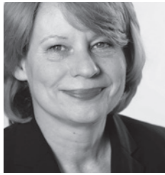
Senatorin Cornelia Prüfer-Storcks, Präsidentin der Behörde für Gesundheit und Verbraucherschutz der Freien und Hansestadt Hamburg und Schirmherrin des Lohfert-Preises 2014